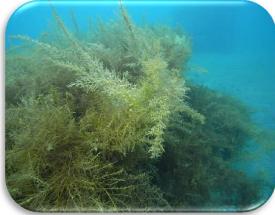
フシスジモク・フシイトモク