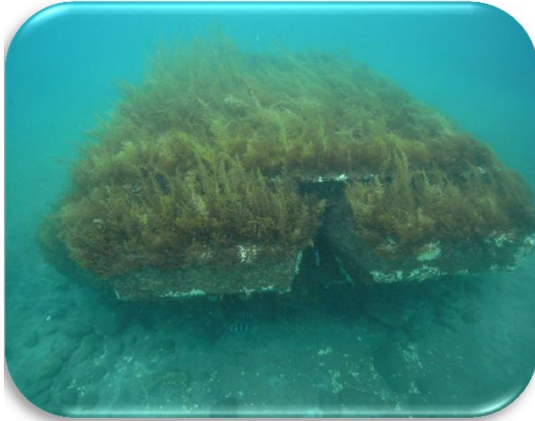
カナクラブロック全景

また、ブロックの隙間や周辺にサザエなどの底生生物やイシダイ、メバル、ホンベラなど魚類の蝸集を確認することが出来ました。