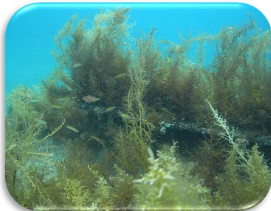
メバル稚魚・ホンベラ